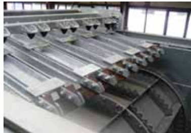
Zakopener te integreren